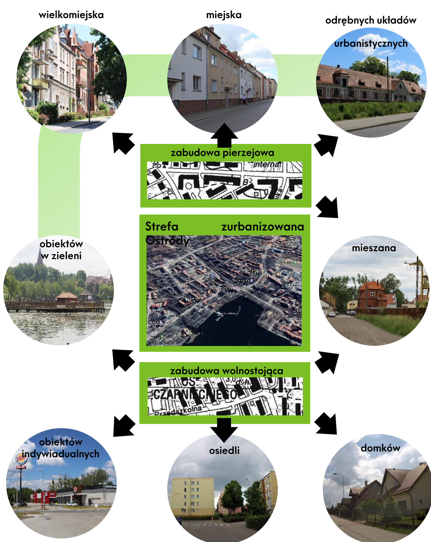
Strefy krajobrazowe - morfologia: